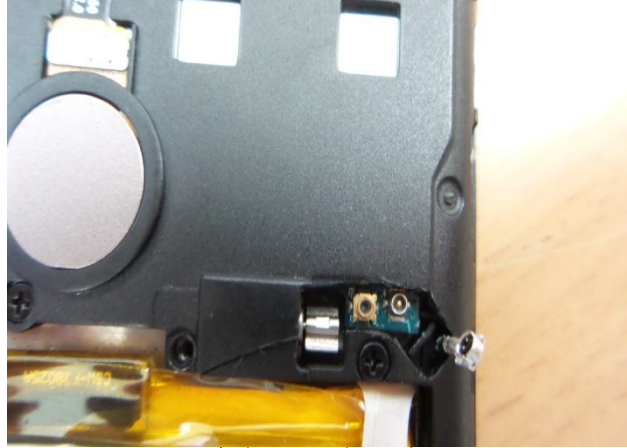
شكل ١: عينة نهائية من الحالة (أ)

٣) يتم تبليغ الشركة المتقدمة (في حالة التليفون و التابلت المحمول يتم كذلك تبليغ المعمل المعتمد الذي أصدر شهادة ال VoC) بنتيجة الإختبارات (تقارير الإختبار المفصلة يتم إرسالها للشركة عند الطلب) و مراجعة التقارير و الشهادات المقدمة للموديل و في حالة نجاح الموديل يمكن للشركة بدء تصنيع أول شحنة منه. ملاحظة: على الشركة المتقدمة مراعاة عدم البدء في تصنيع شحنات من الموديل قبل تبليغها باجتياز الموديل هذه الخطوة بنجاح منعا للتعرض لخسائر حال تصنيع شحنات من موديل ثم تبين عد قبوله.